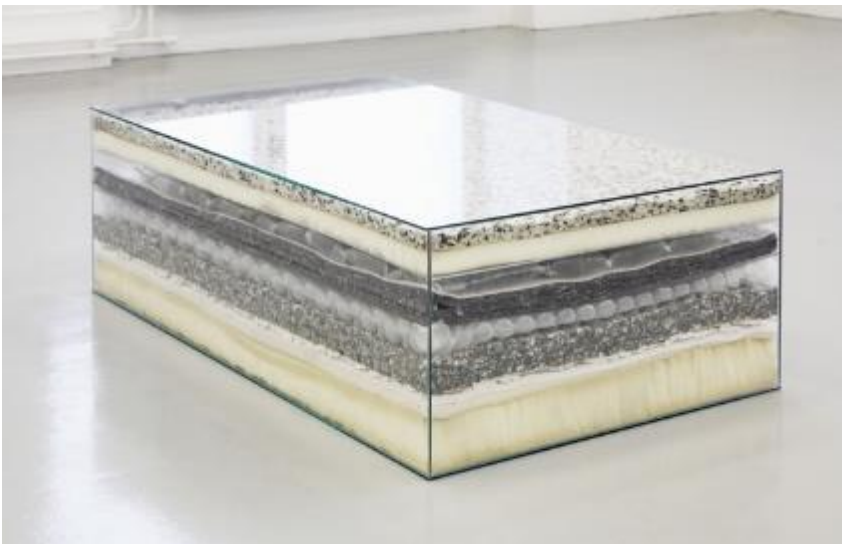
Alina Chaiderov, Spaces Within (Separated from the Outside Air by Layer upon Layer of Protection) , 2014

Il peint souvent des variations d'un seul thème, répétant et modifiant l'image, créant ainsi une analogie visuelle avec l'évolution inévitable des récits historiques tels qu'ils sont racontés et re-racontés à travers les générations.