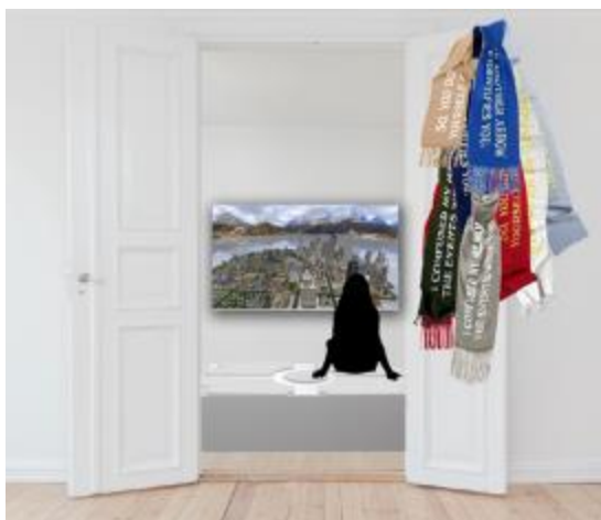
Simulation de l'exposition à la foire

Cette installation d'écharpes représente le besoin des citoyens d'éviter l'identification et le besoin de se protéger des gaz lacrymogènes. Les écharpes placées à la porte de la salle marquent le seuil de l'espace d'exposition, faisant écho au seuil que les individus sont soumis à passer dans le contexte d'une zone sécurisée.