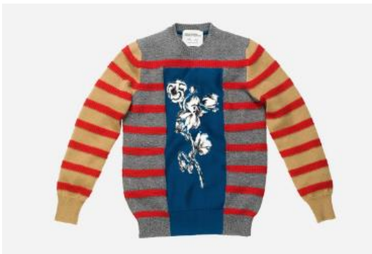
ALLISON KATZ, 2016, Untitled . 100% merino wool (en collaboration avec Paolo Pecora / House of Voltaire) © Allison Katz et Full-Fall Milan

Si les abeilles disparaissaient, le monde prendrait fin dans quatre ans. Suite à la faible prise en compte de la classe politique contre le changement climatique en Europe et dans le reste du monde, Full-Fall entend intervenir de manière active dans un projet qui engage à protéger la planète et son écosystème.