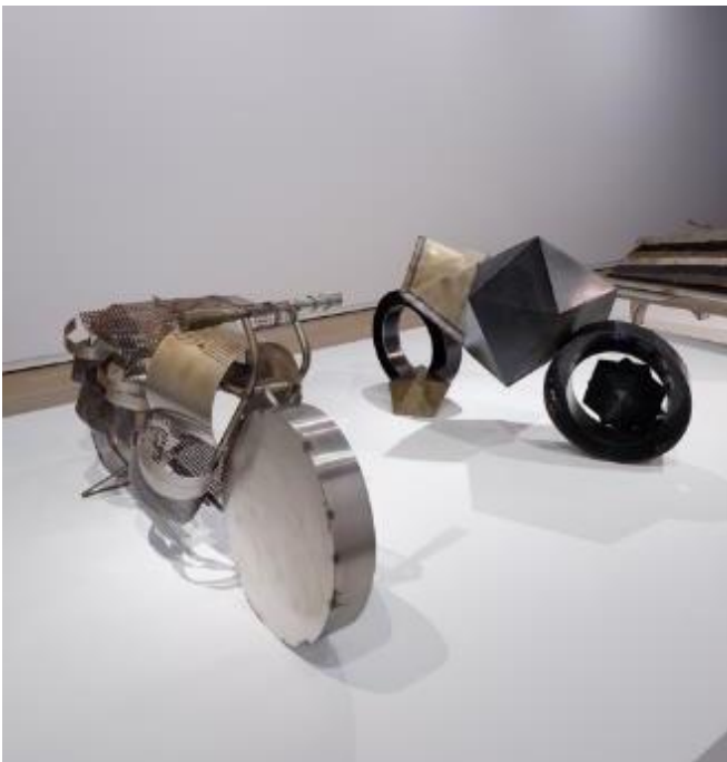
Caroline Mesquita The Ricard Prize, Paris - 2017

L'artiste et dessinatrice californienne Koak crée des univers peuplés de figures féminines aux formes serpentine et organiques. Dans ses dessins et ses peintures colorés, les corps des femmes se contorsionnent, se plient et s'étirent dans des mouvements surréalistes. « Lorsque je dessine ces femmes, le sentiment le plus important que j'essaie d'exprimer est la tension », confie l'artiste.