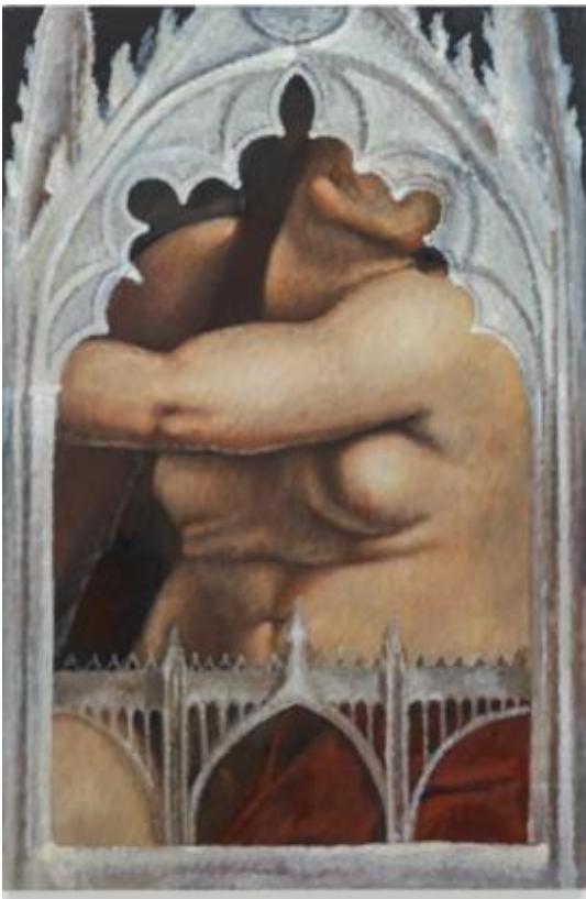
Issy Wood, Will he (2019)

Les peintures de Wood suggèrent un courant de conscience qui cache quelque chose d'inquiétant, un assemblage d'appropriations du style artistique médiéval et des problématiques d'un nouveau temps.