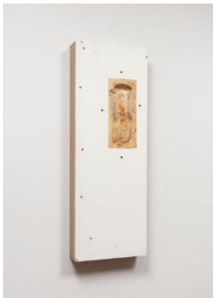
Patricia L. Boyd, Absorption, Elimination: Aeron Exposée au CCA Wattis Institute à San Francisco 10/12/17-02/24/18

L'exposition comprendra des pièces de sa série intitulée Absorption, Elimination, 2017-2019 , qui sont des moules des sections d'une chaise Herman Miller Aeron dans de la graisse de restaurant, de la cire d'abeille et de la résine Dammar.