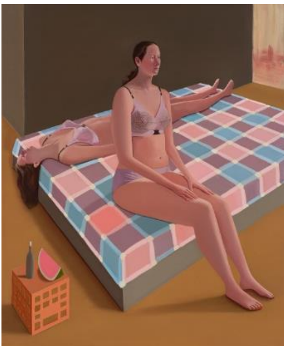
Prudence Flint, The Fitting , 2019 Huile sur toile 130 x 107 cm © Prudence Flint et mother's tankstation Dublin | London

Hannah Levy a organisé sa première exposition personnelle, Panic Hardware , avec mother's tankstation en mai 2018. Son univers, mêlant design et organismes vivants, relève plusieurs matières, parfois dures et froides, d'autres fois souples et douces. Latex, acier, sable, époxy, fibre de verre, silicone, plexi glace, ... Tant de matières pour faire naître ses êtres hybrides, entre objet, design et nature humaine.