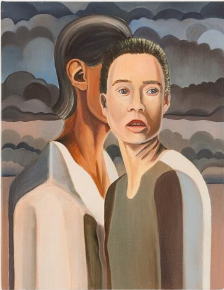
Alan Stanners, Twin , 2018 oil on linen 46 x 37 cm © Allan Stanners et Wschód Gallery

D'abord attiré par l'art abstrait, l'artiste crée aujourd'hui des portraits humains mais aussi des portraits de la vie de tous les jours, pleins d'émotions surtout avec un travail des couleurs précis.