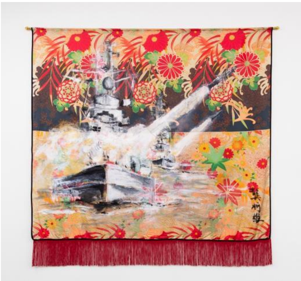
Covey Gong, Untitled (West, North) , 2016

Pour cette édition de Paris Internationale, la galerie choisit de se concentrer sur trois jeunes peintres internationaux. Ces trois jeunes peintres sont Whitney Claflin, née en 1983 à Providence à Rhode Island, Zoe Barcza née en 1984 à Toronto au Canada et Covey Gong né à Hunan en Chine.