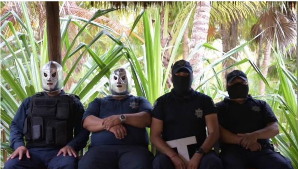
Ahmet Öğüt, The Missing T , 2018, photographie © Ahmet Öğüt et KOW, Berlin

Ahmet Öğüt, né en 1981 à Diyarbakır, travaille avec différents matériaux, souvent liés à l'environnement urbain. Soucieux des rencontres quotidiennes et des moments d'improvisation, ses œuvres traitent de sujets tels que les inégalités structurelles, la pression de l'État, la censure et les formes de résistance. Les actes singuliers de non-alignement ou de luttes collectives contre les puissances militarisées ont également tendance à inspirer les réflexions esthétiques et thématiques de l'œuvre d'Ahmet Öğüt, de même que la manière dont il travaille, respectant l'environnement.