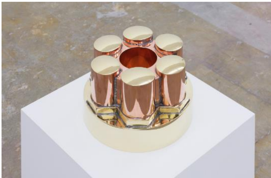
Julien Monnerie Aspic 1 , 2018 laiton, cuivre et étain 8,7 x 28 x 28 cm © Julien Monnerie et Shivers Only

Il participera en septembre à une exposition collective au FRAC Île-de-France.