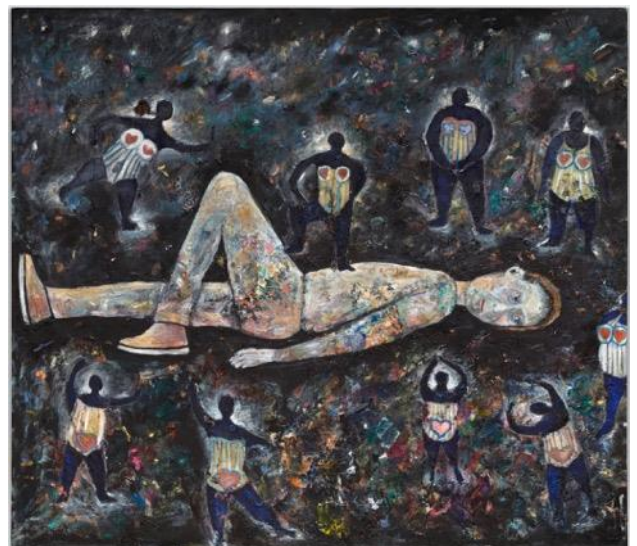
Ellen Gronemeyer Frühspport, 2019 Huile sur toile 140 x 160 cm