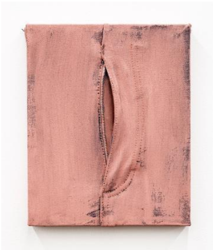
Pia Camil, Bragueta , 2019 Peinture acrylique sur jeans 30 x 25 cm

Pia Camil quant à elle utilise, pour sa série Braguetas , le jean, vêtement unisexe et emblématique. Dissocié du corps humain et vide de son usage premier de protéger et couvrir le corps nu, l'habit devient sujet, le vêtement prend vie. À travers l'ouverture de la braguette du pantalon, elle crée une forme rose ambiguë de sexe féminin, contrastant avec le port de ce vêtement par les hommes. Cette image interroge sur la condition féminine au Mexique, où les pratiques machistes sont omniprésentes. En réutilisant des matériaux de seconde main, elle dénonce également la société de consommation de masse ainsi que le marché noir.